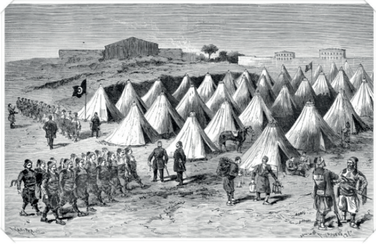
93 Harbi için İstanbul'da toplanan zeybeklerin Feriköy'deki kampları