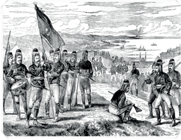
93 Harbi için İstanbul'da toplanan zeybekler (The Illustrated London News: 10 Kasım 1877, s. 460)

Enver Behnan Şapolyo, efelerin kollarına taktıkları pazubentlerin içinde kurşun geçirmez bir muska olduğunu ve bu muskaların içerisindeki yazıların, eski Türklere ait Orhun ve Uygur yazılarına benzediğini aktarmaktadır. Şapolyo, efelerin Oğuz kavmine mensup ve uçlara yerleştirilen gaziler/serdengeçtilerden olduklarını, en eski Türk teşkilatının son kolu olduklarını belirtir. Ayrıca Aşık Paşazade Tarihi 'ni kaynak göstererek Ahilik Teşkilatı içerisinde oluşturulan Yiğit Teşkilatı ile de bağlantılarının olduğunu ifade eder. 2